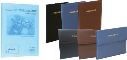
※不動産重要書類ホルダーの一部は受注生産品です