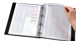
File it シリーズ