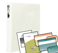
File it home シリーズ