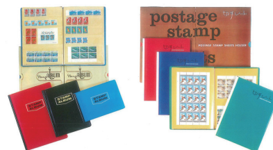
種類豊富な切手アルバム(当時)