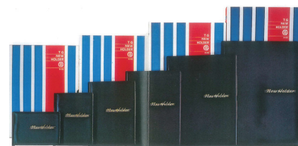
1961年日本初の透明ポケット式ファイル「ニューホルダー」発売(当時)