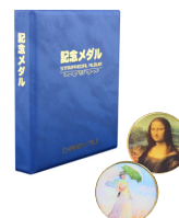
記念メダルシリーズ