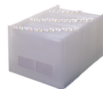
ドキュメントファイル