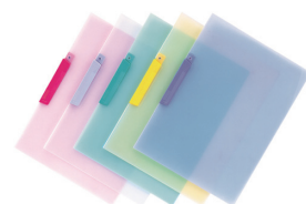
スライドクリップファイルはさんど〜